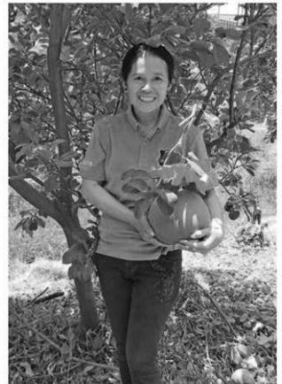
ในสวนปลูกผลไม้หลากหลาย