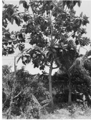
ต้นขมุนลำปะล่อ

หัวข้อข่าว: 'สวนอลิษา' ทุเรียนเมืองนนท์ หมอนทองลูกละครึ่งหมื่น